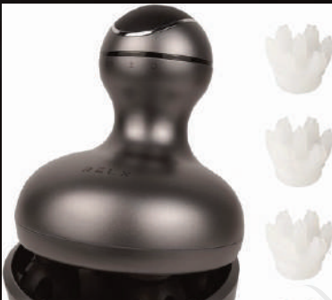
ヘッドマッサージャー (電動頭皮ブラシ)

※当店では状況に応じて『ヘッドマッサージャー』も使用してシャンプーします。ヘッドマッサージャーとは、自動で頭皮を揉みほぐし、頭皮の汚れを落とすことで『頭皮の血行促進や、首や肩まわり、目もとのリフレッシュ、薄毛対策』に効果が期待できるといわれているアイテムです。